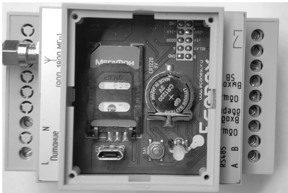
Рисунок 2. SIM-карта, установленная в модуль

3.7. Перед включением в модуль необходимо установить SIM-карту. Для этого нужно снять лицевую панель модуля, как показано на рисунке 2. Затем крышку держателя SIM-карты сдвинуть влево и открыть. После установки SIM-карты необходимо закрыть и зафиксировать крышку держателя, сдвинув ее вправо.